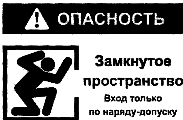
Рекомендуемый знак "ОЗП"

2. Объекты, вошедшие в Перечень 1 и не являющиеся территориально обособленными объектами, должны быть обозначены знаком "ОЗП" (рекомендуемый текст).